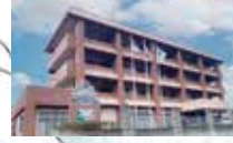
ケアハウス マリア・テレジア [訪問介護 健祥会たんぼぼ]