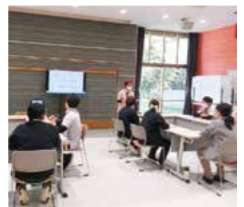
R7.11.14 第2回リーダー研修会 ひかり会場