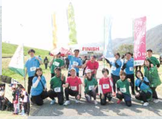
R7.4.6 にし阿波リレーマラソン / シェーンステージ