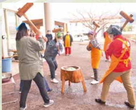
R7.12.27 餅つき / シェーンステージ