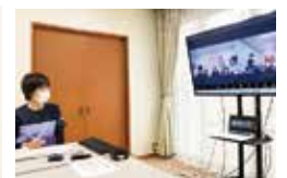
リモート会議の様子