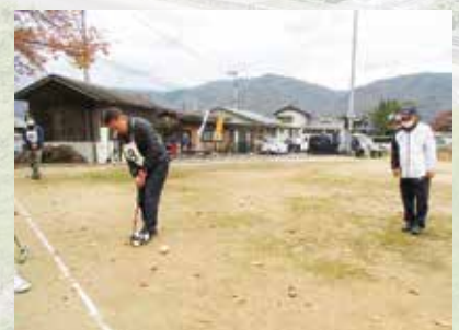
R7.11.18 東みよし町GB大会 / シェーンステージ

地域貢献活動の一環として、清掃活動やサロン活動、地域行事への参加を継続的に行っています。通学路や施設周辺の清掃を通じて、地域の皆様が安心して暮らせる環境づくりに努めるほか、サロン活動では住民同士の交流を深め、心身の健康を支える場を提供しています。また、お祭りや防災訓練などの地域行事に積極的に参加することで、地域との連携を強めながら、社会福祉法人としての役割を広く知っていただく機会にもなっています。これらの取り組みを通じて、私たちは地域に寄り添い、誰もが住みやすいまちづくりに貢献することを大切にしています。