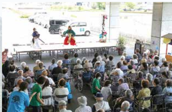
R7.6.21 あじさい祭り / 健祥会たんぽぽ