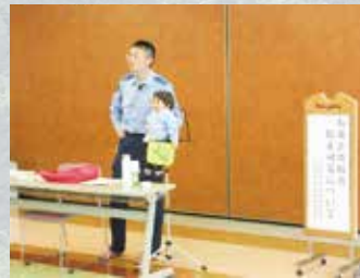
R7.5.12 健祥会サロン (警察署員による振り込み詐欺防止講座) 三加茂4施設