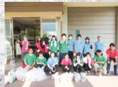
R7.7.31 清掃活動 健祥会シェーンブルン