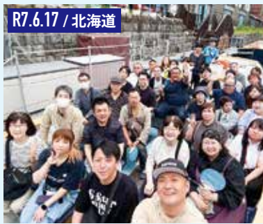
R7.6.17 / 北海道 夏の北海道では小樽運河クルーズを体験。