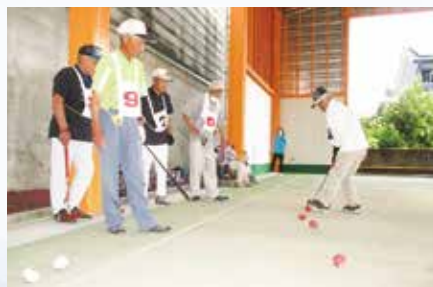
R7.7.31 ゲートボール大会 / 健祥会シェーンブルン