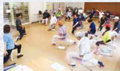
R7.7.31 健康体操 / 健祥会シェーンブルン