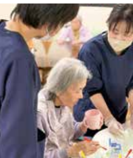
口腔ケアの質の向上へ