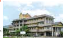
老人保健施設 健祥会シェーンブルン [通所リハビリテーション] [訪問リハビリテーション] [居宅介護支援事業所 健祥会ケアプランセンターみよし]