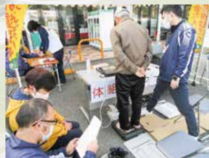
R7.11.11 介護の日 / 三加茂4施設