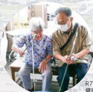
R7.8.9 納涼祭 健祥会いこい