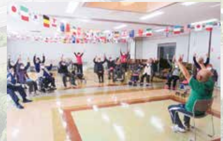
R7.10.31 運動会 / マリア・テレジア

地域貢献活動の一環として、清掃活動やサロン活動、地域行事への参加を継続的に行っています。通学路や施設周辺の清掃を通じて、地域の皆様が安心して暮らせる環境づくりに努めるほか、サロン活動では住民同士の交流を深め、心身の健康を支える場を提供しています。また、お祭りや防災訓練などの地域行事に積極的に参加することで、地域との連携を強めながら、社会福祉法人としての役割を広く知っていただく機会にもなっています。これらの取り組みを通じて、私たちは地域に寄り添い、誰もが住みやすいまちづくりに貢献することを大切にしています。