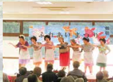
R7.10.18 ふれあいまつり 健祥会清盛・健祥会頼朝