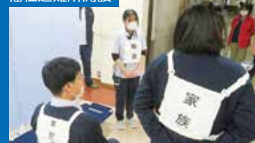
R7.11.26 健祥会清盛・頼朝