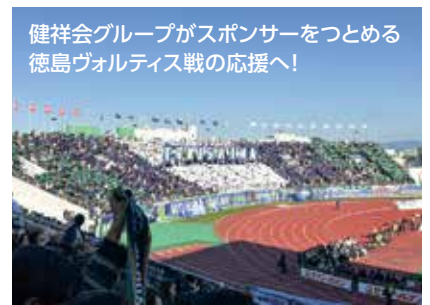
健祥会グループがスポンサーをつとめる徳島ヴォルティス戦の応援へ！ ポカリスエットスタジアム スタジアムの一体感を肌で感じて身も心もリフレッシュ！