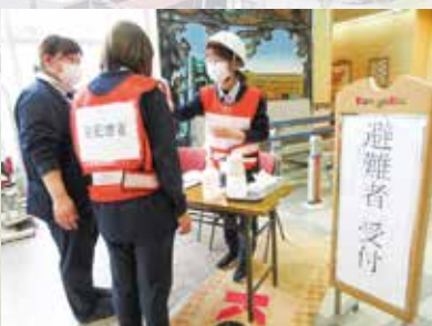
R7.11.26 福祉避難所開設訓練 / シェーンステージ