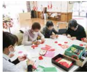
手芸・作品づくり