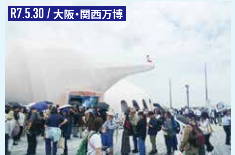
R7.5.30 / 大阪・関西万博 パソナパビリオンは万博会場を象徴するパビリオンのひとつです。歴史的なイベントでした。