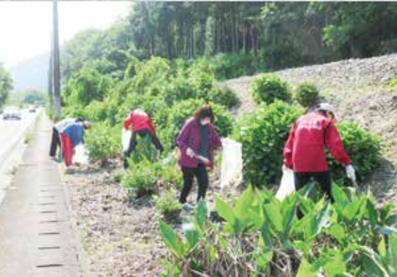
R7.5.31 清掃活動 / 健祥会たんぼぼ