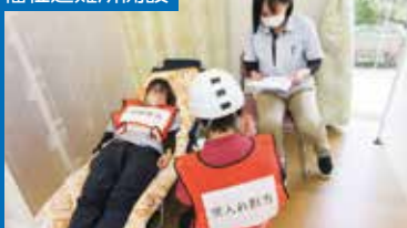
R7.11.26 健祥会シェーンブルン