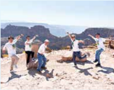
アリゾナ州グランドキャニオン 透き通るような青い空と雄大な自然が魅力的でした。