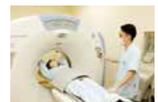
ヘルスサポート制度