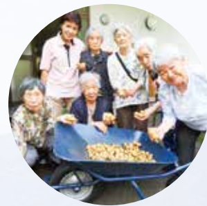
R7.6.29 園芸(じゃがいも収穫) 健祥会頼朝