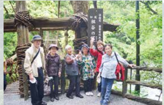
R7.5.15 遠足(祖谷のかずら橋) / マリア・テレジア