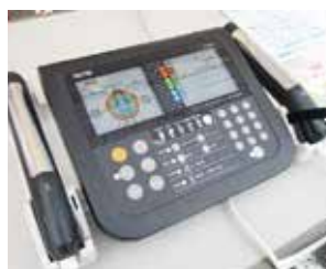
体組成計の測定値を活用