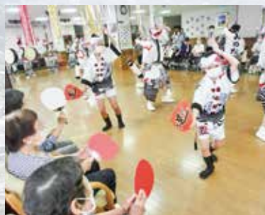
R7.8.15 阿波踊り / 健祥会たんぽぽ