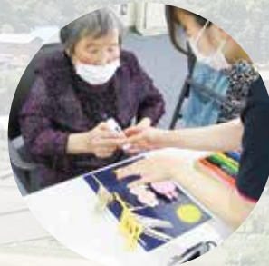
R7.9.9 さんカフェ / 健祥会いこい