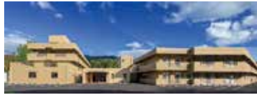
特別養護老人ホーム ひかり 養護老人ホーム しのめ