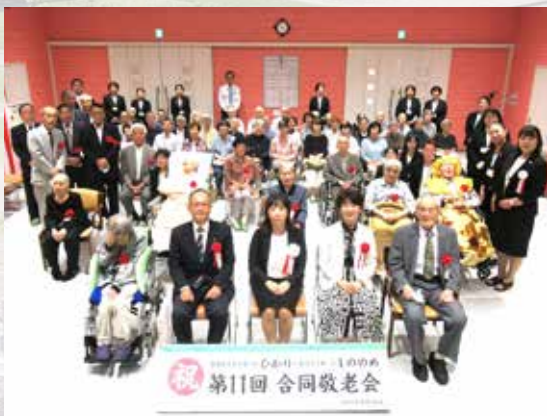
R7.9.16 合同敬老会 / ひかり・しのめ