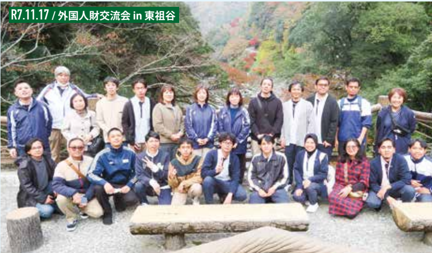
R7.11.17 / 外国人財交流会 in 東祖谷