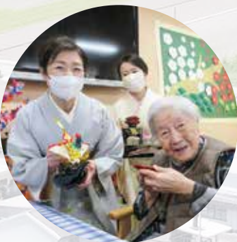
R7.1.1 新年お屠蘇の儀 健祥会シェーンブルン