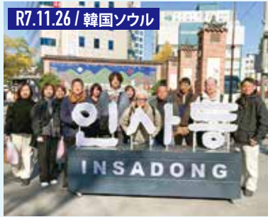
R7.11.26 / 韓国ソウル 韓国は伝統文化と、近代的で都会的な空間が融合する魅力的な場所です。もちろんグルメも楽しみました。