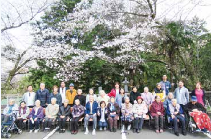
R7.4.3 お花見 / ひかり・しのめ

四季の移ろいを感じられるよう、年間を通して多彩な行事を実施しています。春は満開の桜の下での散歩や作品づくり、夏は涼を楽しむ納涼会、秋は秋祭りや運動会、冬は華やかなクリスマス会など、利用者様が笑顔で参加できる催しを大切にしています。こうした行事を通じて、日々の生活の中で温かな交流が生まれ、職員と利用者様が共に過ごす穏やかなひとときが生まれています。四季折々の魅力と共に、皆様の暮らしを豊かに彩る行事を今後も大切にしていまいります。