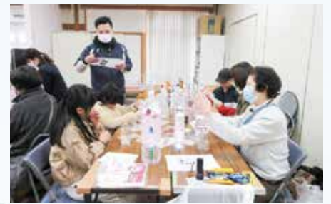
R7.3.9 東みよし防災フェスティバル / 三加茂4施設