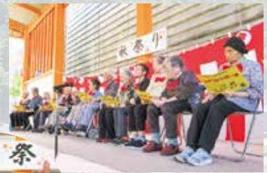
R7.10.10 秋祭り 健祥会シェーンブレン