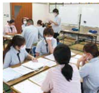
R7.7.9 第1回リーダー研修会 健祥会たんぼ会場

安心して毎日を過ごしていただくためには、現場で働く職員一人ひとりの力が大切です。シェーンステージでは、施設の中心となる職員が集まり、「今、困っていること」「もっと良くしたいこと」について話し合い、解決策を考えるプロジェクトチームを立ち上げ、メンバー自身が講師となつての研修を（年2回）行っています。自分たちで考え、話し合い、行動する力を身につけることで、利用者様への関わりや支援の質がより良いものになると考えています。職員の疑問や提案を取り上げながら、これからも一人ひとりの学びを大切に、皆様が安心できる暮らしにつながるサポートを続けてまいります。