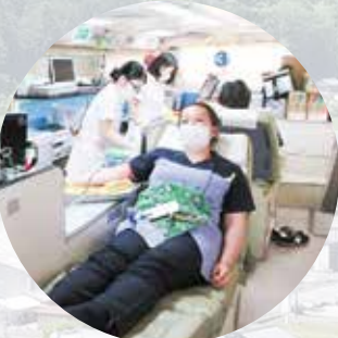
R7.8.22 献血 / シェーンステージ