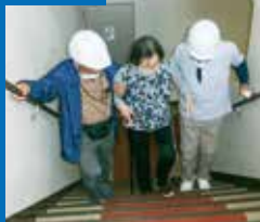
R7.3.26 マリア・テレジア