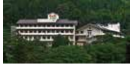
特別養護老人ホーム 健祥会清盛 [訪問介護 健祥会清盛] 養護老人ホーム 健祥会頼朝