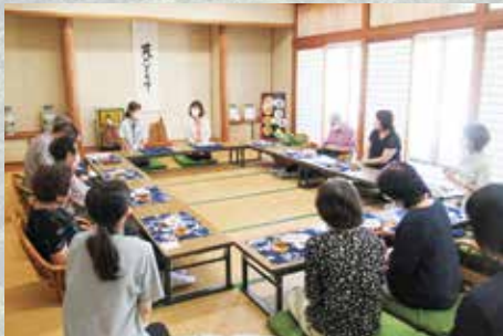
R7.9.1 たんぼぼカフェ / 健祥会たんぼぼ