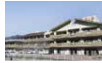
特別養護老人ホーム 健祥会たんぼぼ [通所介護 デイセンターバタフライ]