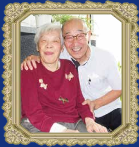
お誕生日記念写真