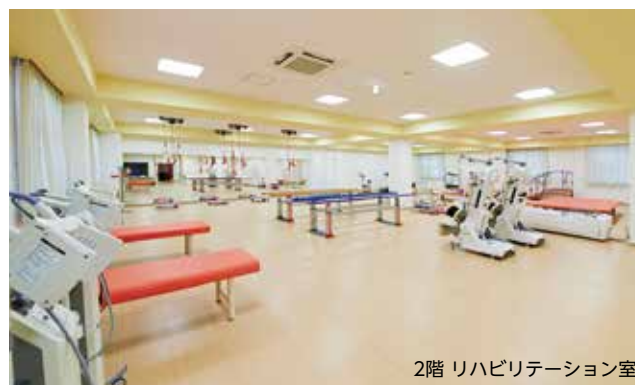
2階 リハビリテーション室