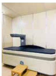
骨密度測定装置 (DEXA法)