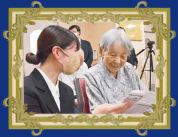
ご長寿おめでとうございます