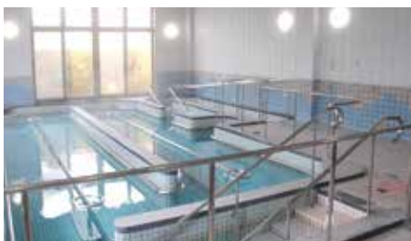
歩行浴 (温水プール)