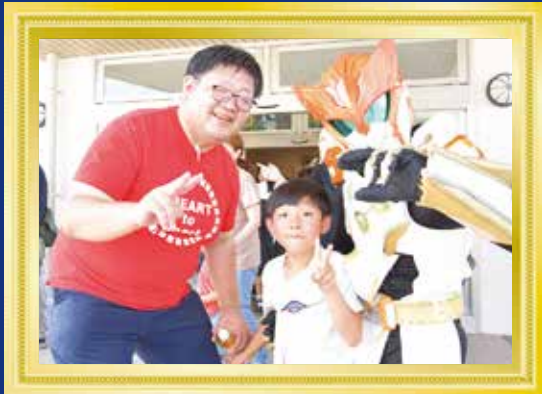
雷剣戦士イザギと！