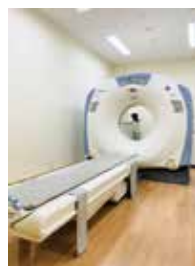
CTスキャナシステム