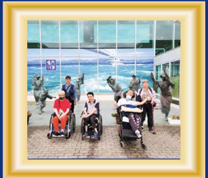
空の玄関でパシャリ