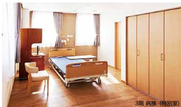
3階 病棟 (特別室)