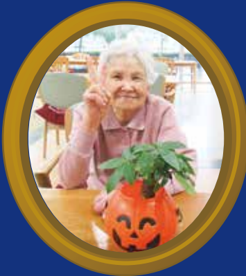
ハッピーハロウィン♪