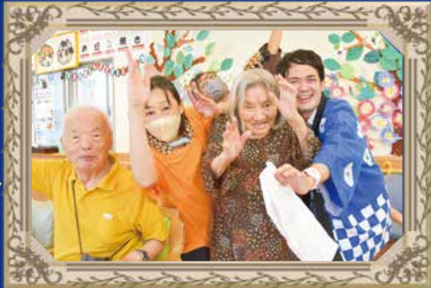
暑さに負けない納涼祭！