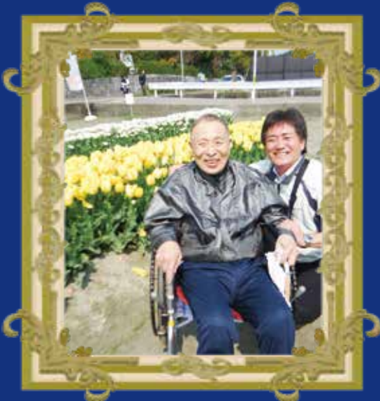
満開のチューリップ