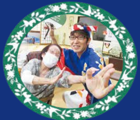
踊らにゃそんそん♪