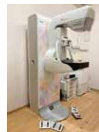
デジタルマンモグラフィシステム