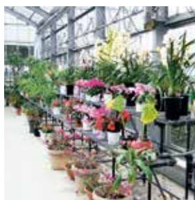
健祥会ふれあいハウス