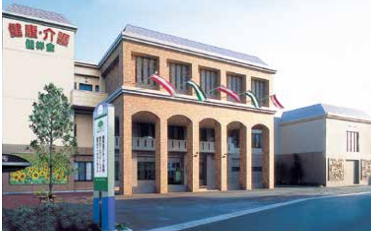
介護ロボット展示室

施設理念 地域に根ざした施設づくりを目指し、介護の知識・技術を普及するため地域に向かい発信します。