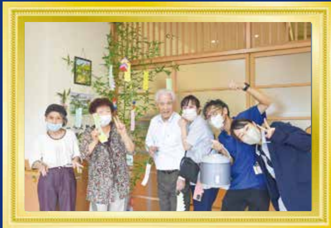
七夕に願いをこめて