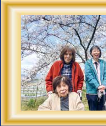
暖かくなってきま