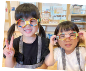
#ラキューで メガネを作ったよ