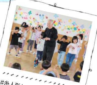
#糸人形と一緒に阿波踊り #やっどさ〜、やっどやっど!