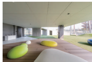
ウッドデッキと園庭の個性豊かな遊具たち

照明を施した折上げ天井やフロアや建具の色使いまで、未来空間のような園舎は安全と合理的な保育ICTシステムで運用されます。2階と園庭をつなぐ円形スロープは、平時は遊び場、災害時には安全な避難路に。