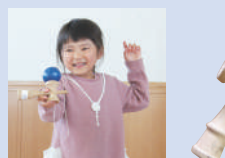
徳島眉山木鶏クラブ 黒瀬 英作 講師