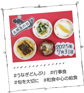
#うなぎどんぶり #行事食 #旬を大切に #和食中心の給食

みんなで育てて、みんなで食べる。旬の食材の味や香りを感じながら、「おいしいね!」の笑顔が広がります。食を通して、心も体もすくすく育ちます。