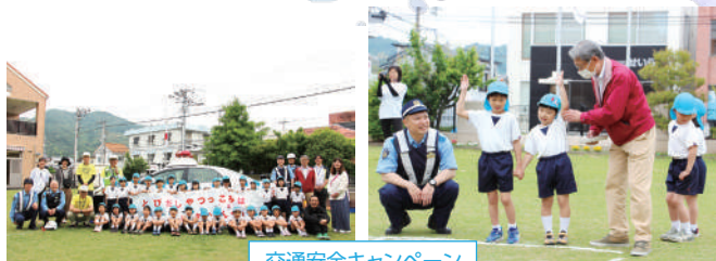
交通安全キャンペーン