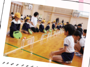
2025. 10. 21 #小学校との交流 #小学校はとっても楽しいよ