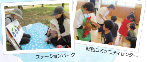
ステーションパーク

地域の公園や2丁目ひろば(スリジエ子どもと大人のクリニック2階)で育児相談や遊びの提供を行っています。