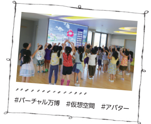
#バーチャル万博 #仮想空間 #アバター