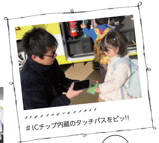
#ICチップ内蔵のタッチパスをピッ!