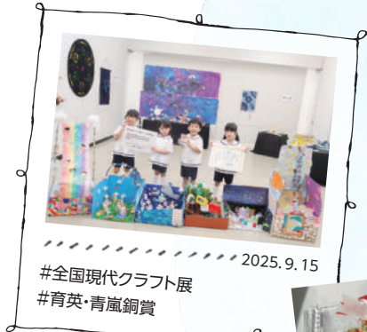
2025. 9. 15 #全国現代クラフト展 #育英・青嵐銅賞