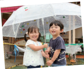
#雨の日のお楽しみ

2025年の出生数も合計特殊出生率もいずれも過去最低を更新しました。今、少子化対策は社会の最も大きな課題であり、生まれくる子どもたちの乳幼児期教育を担う私たちの役割はますます重いものになっています。このことをしっかり胸に刻み健康と安心の日常を守りながら、子どもたちの豊かな未来のために頑張っていまいりますので、変わらぬご支援・ご協力を賜りますようお願い申し上げます。