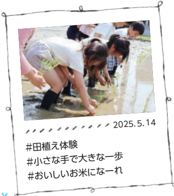
2025. 5. 14 #田植え体験 #小さな手で大きな一歩 #おいしいお米になーれ

こども園での毎日は、ワクワクがいっぱい! 子どもたちは遊びや自然の中で、「できた!」「ふしぎ!」「たのしい!」を見つけます。手で触れて、目で見て、心で感じる。友だちと力を合わせたり、失敗してもまた挑戦したり。そんなはじめての積み重ねが、子どもたちの心をそっと育てます。原体験は、未来へ向かう大切な根っこ。子どもたちの人生を、キラキラと照らしていきます!!