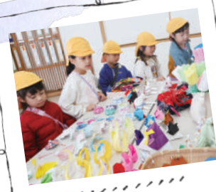
#地域の文化祭へ #すごいね、おもしろい!