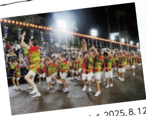
2025. 8. 12 #阿波踊り #ちろど連 #やっどさー!! #踊りは〜♪健祥会!!

健祥会ちろど連の5歳児が、健祥会グループ連と一緒に阿波踊りに参加しました。熱気あふれる監場浜演舞場では、子どもたちの元気な掛け声が響き渡りました。観覧していた方々からは、温かく力強い拍手をいただき、子どもたちも誇らしげな表情を見せていました。