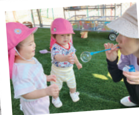
#しゃぼん玉プー #おててでそおーつと