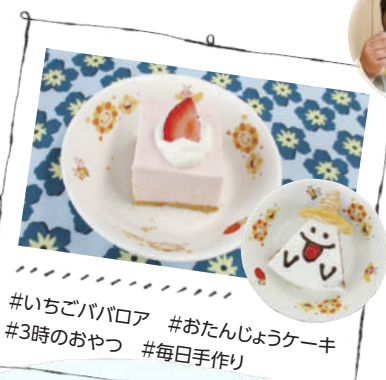
#いちごババロア #おたんじょうケーキ #3時のおやつ #毎日手作り