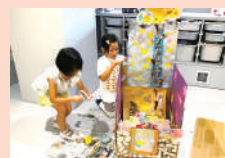
徳島県立近代美術館より 講師を招いて