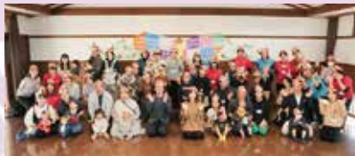
子育て支援「KIRARI 仕事と子育て両立パバセミナーイベント」