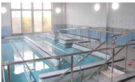
歩行浴 (温水プール)