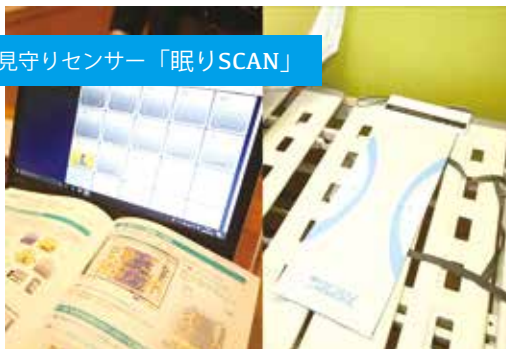
見守りセンサー「眠りSCAN」