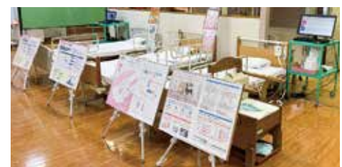
介護ロボット展示室