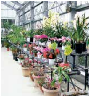
健祥会ふれあいハウス