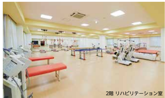
2階 リハビリテーション室