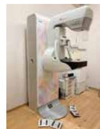
デジタルマンモグラフィ システム