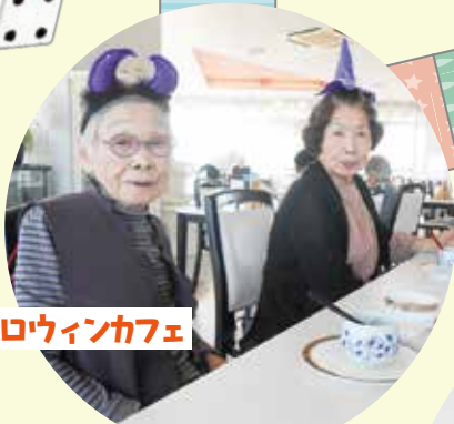
ハロウィンカフェ