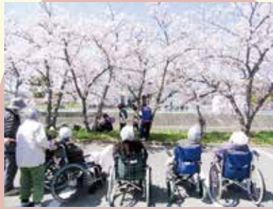
2023.4.1 お花見 (グループホーム藤吉郎)