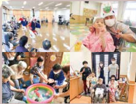
2023.8 納涼祭 (各施設)