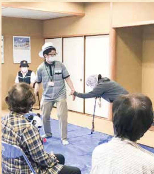
2023.6.8 (グループホーム濃姫)