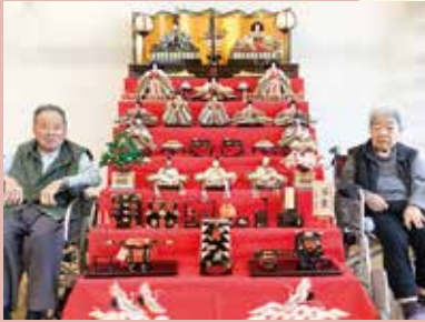
2023.3.3 ひなまつり (健祥会ハート)