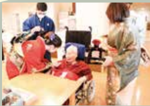
2023.1.1 新年お屠蘇の儀 (健祥会ライデン)