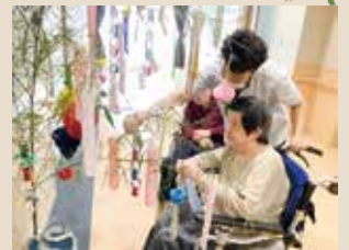
2023.7.7 セタ (健祥会ライデン)