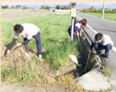
2023.4.9 (グループホーム濃姫)