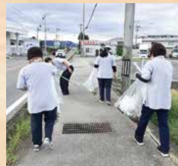
2023.9.7 (デイセンター日吉丸)