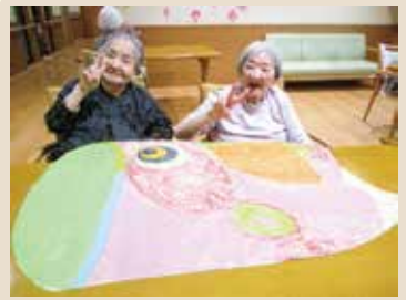
2023.5.5 こどもの日 (グループホーム濃姫)