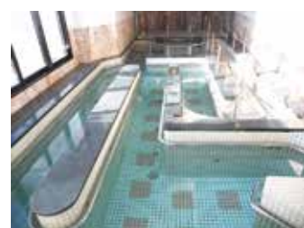
歩行浴 (温水プール)