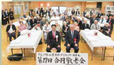
2023.9 合同敬老会 (各施設)