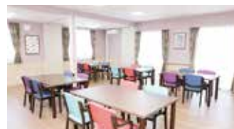
ダイニング・食堂