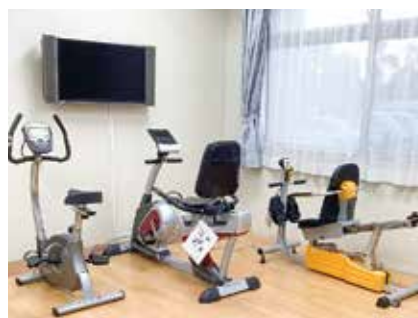
トレーニングマシーン