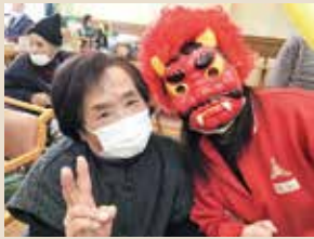
2023.2.3 節分 (デイセンター上総介)