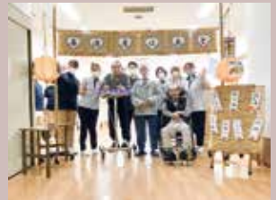
2023.6.18 父の日居酒屋 (健祥会ハート)