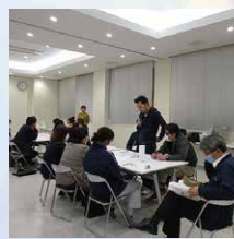
つるぎ町社会福祉協議会 地域拠点センターにて（定例会）

健祥会の取り組みから連携がスタート。「なんでも相談窓口」の設置や認知症カフェの開催、福祉避難所設置・運営訓練の実施、またCSW育成を目的とした研修会など、地域福祉の推進のために7法人が連携し取り組んでいます。地域の暮らしにまつわる課題解決に向け毎月の定例会で熱く語り合っています。