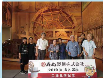
石丸製麺株式会社 2019年8月23日 工場見学記念