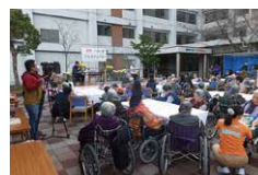
健康いきいきフェスティバル

「いい日、いい日、毎日、あったか介護、ありがとう」11月11日は介護の日です。ウエストステージ6事業所においては、地域の方々との交流や介護・福祉の理解を深める機会にしています。ステージ各施設の特色を活かした活動を通して、介護の在り方について、再認識する日となりました。