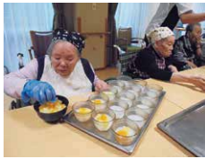
調理レクリエーション

充実した毎日過ごすためにお互いのコミュニケーションをふかめ、食事やリハビリテーションを楽しみながら、過ごしていただけるよう努めてまいります。