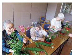
趣味レクリエーション