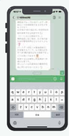
健祥会グループ職員限定