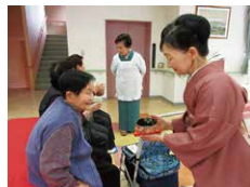
地域ボランティア来設