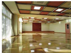
地域交流スペース