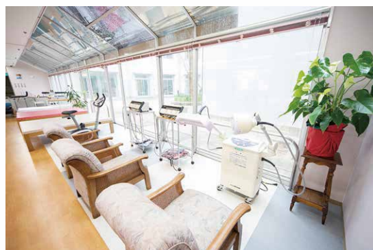
2020年4月から、改装した施設で快適な暮らしをお届けします。