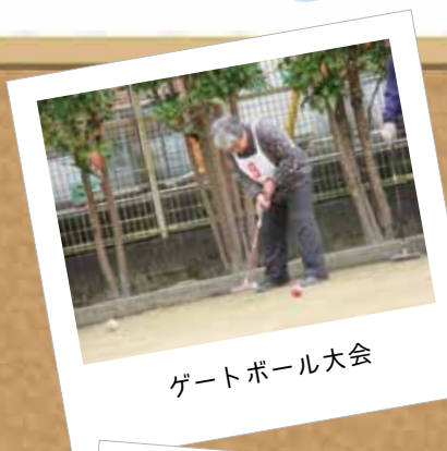
ゲートボール大会

ハートではみなさまに感謝し、地域との繋がりを大切にしています。ゲートボール大会の開催や学校からの職場体験の受け入れ、集会所での出張リハビリ教室など、さまざまな地域貢献活動を行っています。