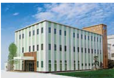
むくの木クリニック 徳島市国府町

健祥会グループの医療機関として 2014 年オープンしたむくの木クリニック。最新の医療機器を備え、職員の健康をサポートします。人間ドックの助成金制度もあり、機能訓練指導員が身体に負担の少ない介護方法を指導し腰痛予防を推進するなど、職員の健康管理に力を入れています。