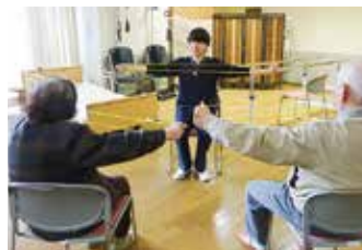
訓練指導員による体操