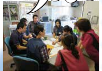
多職種でのカンファレンス