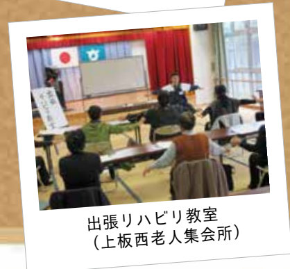
出張リハビリ教室 (上板西老人集会所)