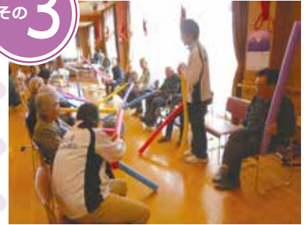
遊びリテーション