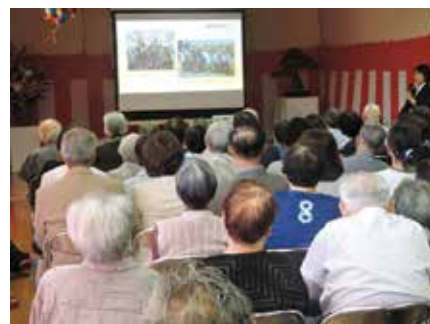
開所からの振り返り