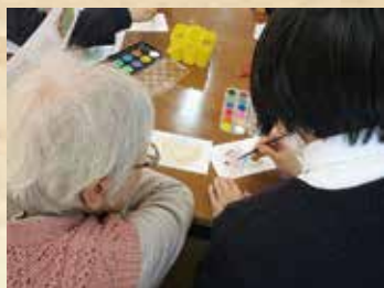
名西高校 美術部のみなさまによる絵手紙教室