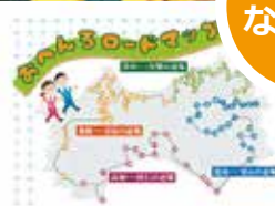
おへんろウォーキング