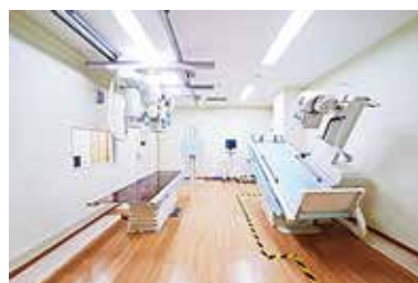
一般の方もご利用いただけます