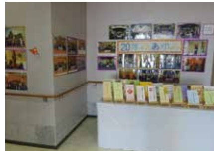
これまでの歩みの展示

健祥会プロバンスは、みなさまのご支援・ご協力のおかげで2019年6月1日に開所20周年を迎えることができました。ありがとうございました。これからも利用者様のことを第一に考え、高品質なサービスを提供できるように努めてまいります。これからも宜しくお願い致します。