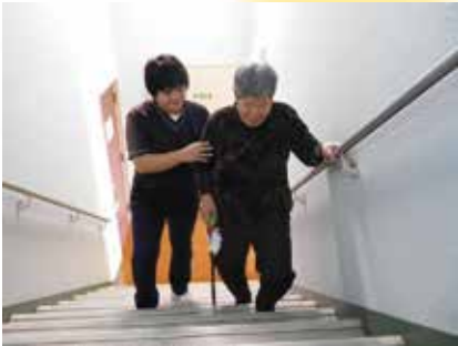
階段での歩行訓練

デイケアでは理学療法士、作業療法士がその人の能力に応じて可能な限り、自立した日常生活を営むことができるよう、まごころを込めてリハビリを行っています。より日常に近いリハビリができるよう、屋外や外出先での歩行訓練に積極的に取り組んでいます。ウォーターベッドやホットパックなど心身の機能を維持、回復が期待できる設備も整っています。皆様の隠された身体機能を引き出すことにより、一層快適な日常生活が送れるようにサポートします。