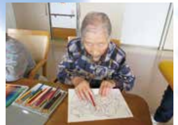
脳機能トレーニング