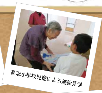
高志小学校児童による施設見学