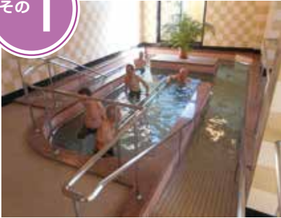
温水プールでの歩行浴