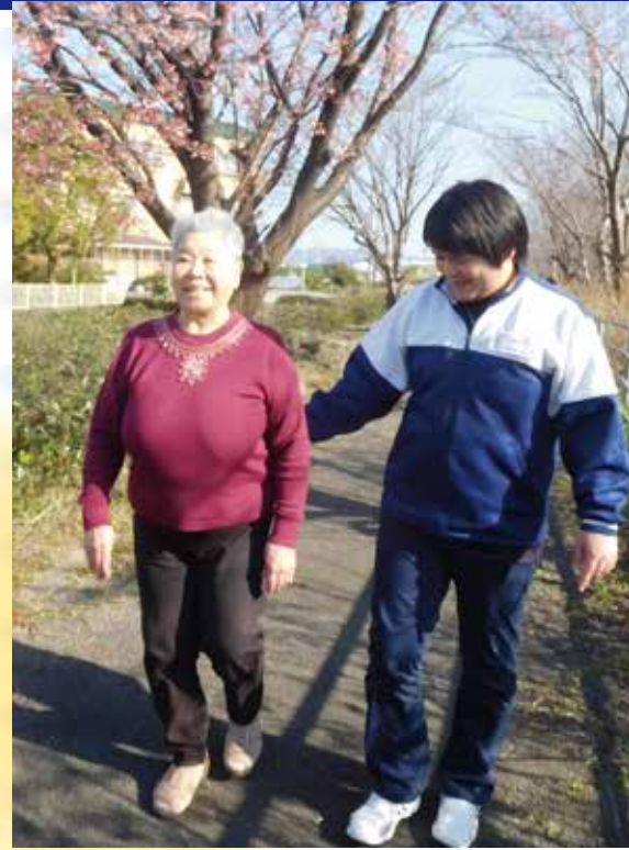
施設外での歩行訓練