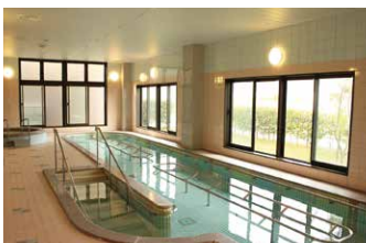
歩行浴・ジャグジー

■歩行浴…浮力により、膝や腰に負担をかけず、楽に運動ができ、水の抵抗による負荷で筋力や筋持久力が強化されます。