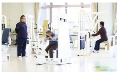
マシントレーニングコース

健祥会独自の健康づくり教室です。パワー・デイ卒業後は88歳教室でトレーニングを継続し、健康維持・アンチエイジングをめざしましょう。