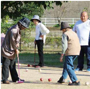
オレンジカフェ ゲートボール