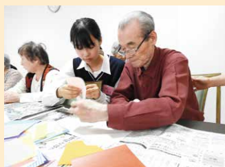
川島高校生との交流会