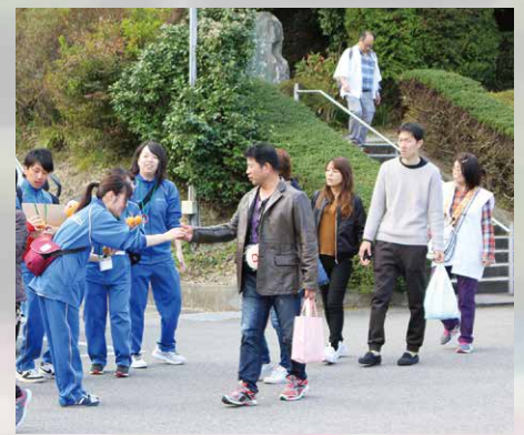
各札所で参拝者にお接待