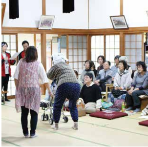
認知症サポーター養成講座