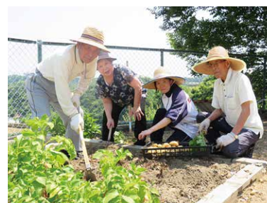
農園での野菜の収穫

利用者様の好みや身体機能に合わせて、お昼ごはんの一品やおやつづくり、お茶の準備、食器の洗浄をしていただき、デイサービスでの役割づくりを行っています。