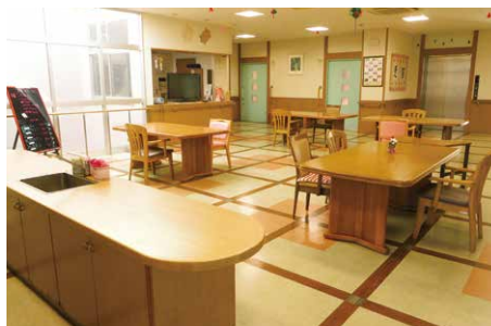
アネックス 4階 フロア