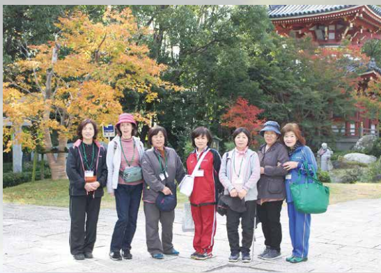
参加して下さった地域の方と

5番札所 地蔵寺 → 6番札所 安楽寺 → 7番札所 十楽寺 → 8番札所 熊谷寺