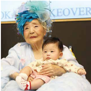
0歳から100歳OVER ファッションショー