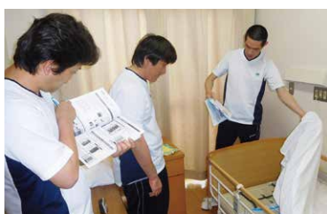
使用方法についての研修

昨年度より導入された介護システム「眠りSCAN」。これを使用することにより、体動(寝返り・呼吸・心拍など)を測定し、睡眠状態を把握します。その情報を基に、ケアプランの見直しや利用者様の生活習慣の改善に役立っています。