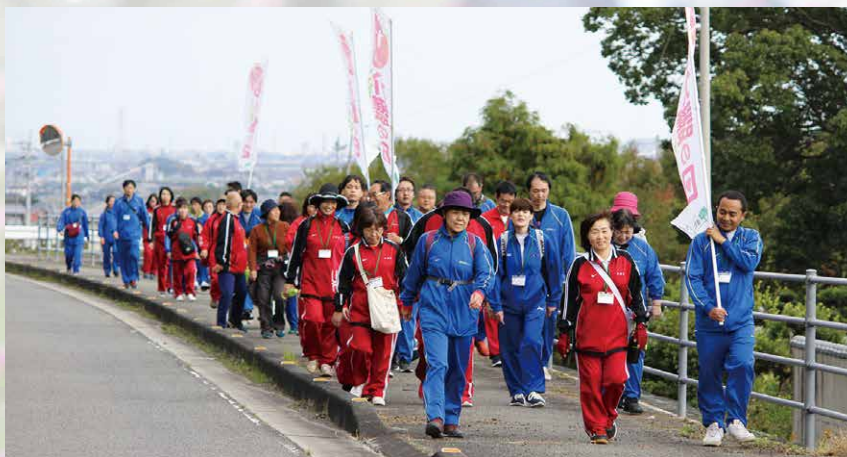
「介護の日」ののぼりを掲げて

平成20年、厚生労働省が介護について国民が理解と認識を深める日として定めた「介護の日」。健祥会グループでも、「すべての人が支え合う気持ちを持つ日」そして、「福祉現場で働く私たちが介護と自分自身を見つめ直す日」として、3年前から介護の日のイベントに取り組んでいます。スタートIステージでは毎年、「四国八十八箇所参り」を実施し、今年も地蔵寺から熊谷寺までを「介護の日」ののぼりを掲げ歩きました。今年も少し肌寒く、季節の移り変わりを肌で感じながら、いつまでも変わらない住み慣れたまちの景色と、地域のみなさまの笑顔の中を、介護の未来や夢を語り合いながら歩くことで、これからも地域のために、地域とともに歩み、絆を大切に、支え合う社会づくりをめざす意思を再認識しました。