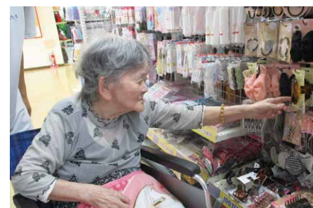
お楽しみのショッピング

春にはお花見、夏にはホテル観賞、秋には菊人形見学と、利用者様に四季を感じていただけるよう、外出支援を行っています。また、毎月フロアごとにショッピングにも出かけ、自分でほしいものを選んで購入していただき、自立支援につなげています。