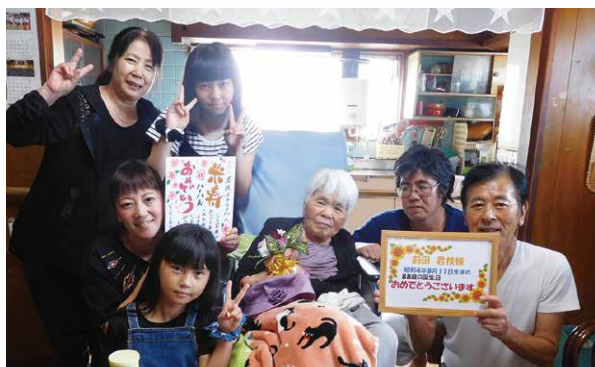
我が家でご家族と過ごされました

誕生日は誰にも訪れる、年に1度の特別な日です。この特別な日が、利用者様の人生の中で、思い出に残る素晴らしい1日になるよう取り組んでいます。プレゼントをお渡すだけでなく、利用者様やご家族の希望をお聞きし、外出や外泊、外食の送迎などをサポートさせていただいています。お誕生日にご自宅まで送迎をさせていただいた際には、利用者様やご家族より「送ってもらってありがとうございます。」という嬉しいお言葉をいただきました。