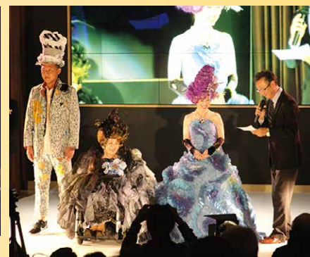
娘様ご夫婦と一緒に素敵な思い出ができました