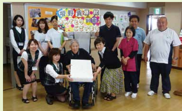
お誕生日の記念撮影 / 1階訓練室にて

年に1度の特別な日、利用者様の誕生日には、職員みんなが集まりお祝いし、記念撮影をします。誕生日に叶えたいことをお聞かせいただき、ご家族や仲良しの利用者様との外出、施設で一緒におやつづくりなど、“主役”の1日を思い出に残る日となるようお手伝いをさせていただきます。