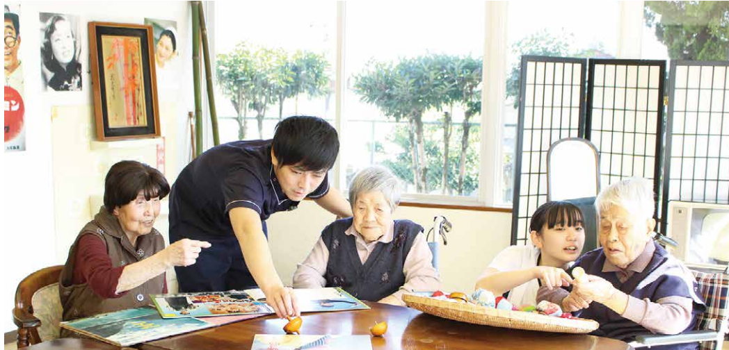
懐かしい昭和グッズに囲まれて

そこに利用者様にお集まりいただいて、「食事」「外出」「趣味・娯楽」をテーマに「入所者会議」を開催。意見や思いを聞かせていただくとともに、みなさまの思いに添ったレクリエーションを実施しました。その取り組み内容を7月の「水明荘家族会」で発表させていただき、ご家族にも「昭和の部屋」を見ていただくと、真空管のテレビなどを持ってきて下さり、さらに懐かしい空間が完成しました。そこでおやつを食べたり、回想法を交えた行事に参加していただくことで、笑顔の絶えない、より充実した水明荘での生活を送っていただいています。