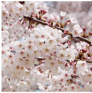
水明荘前庭の桜の花