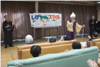
ボランティアによる演芸

施設での生活の中で、四季折々の植物を育て、利用者様に季節を感じていただいたり、地域のイベントへの参加やお買い物、外出など、より生きがいを感じる時間を持っていただいています。また、ボランティアによる楽しい劇や歌などで、地域の方々との交流をはかり、ふれあいの中で安らぎを感じていただいています。