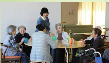
地域のボランティアの方と

毎月第4木曜日に開催しているオレンジカフェ。理学療法士、管理栄養士、歯科衛生士などの専門職がお話をさせていただき、地域のみなさまの健康増進のお手伝いをします。また、オレンジカフェに参加して下さった方や、地域の婦人会のみなさまがボランティアで施設を訪問され、昔遊びや紙芝居などで利用者様との交流を楽しんでくださっています。