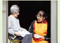
ほっこりやすらぎのひととき

ホームヘルパーがご自宅を訪問します。ベテラン主婦の経験も生かしながら調理や清掃などのお手伝いをします。縁側で洗濯物をたたみながらおしゃべりしたり、穏やかに流れる時間を一緒にしながら、利用者様自身ができることが増えるよう、支援させていただきます。