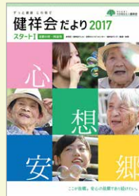
だよりコンテスト2017 第1位

職員が日常の中で見つけた利用者様のいい顔、いい姿。その時にしか見ることのできない瞬間を、お一人おひとりの人生の大切な記録としてカメラにおさめています。