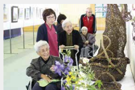
吉野川市文化祭作品展見学

春にはお花見、夏にはホテル観賞や阿波踊り見物、お寺参りなど、時節を感じていただける行事を企画し楽しいひとときを過ごしていただいています。