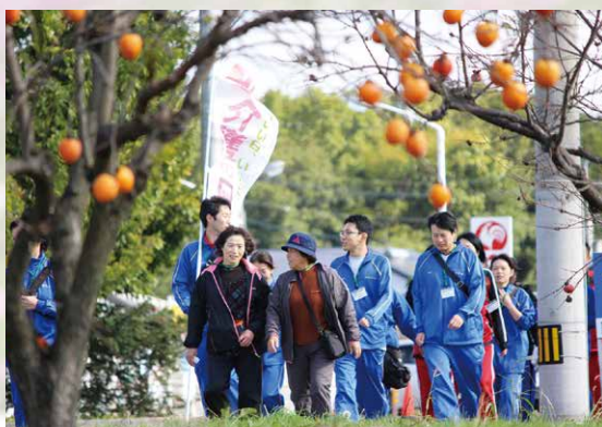
季節の色に囲まれて

安楽寺 多宝塔と紅葉の前で スタートIステージ職員と地域の参加者総勢68名で記念撮影