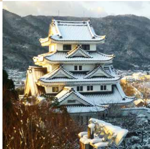
雪化粧した川島城