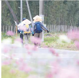
善入寺島のコスモスとお遍路さん