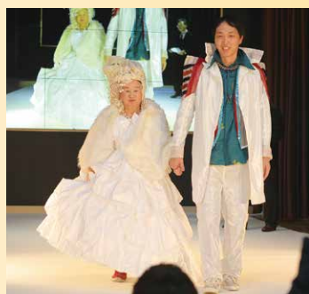
リハビリ担当職員と一緒に笑顔でリラックスして歩くことができました

利用者様が参加されました。普段着ることがないような煌びやかな衣装を身に付け、職員やご家族と一緒にステージを歩かれました。「すごい衣装やな。いい思い出になって良かった」と喜ばれていました。