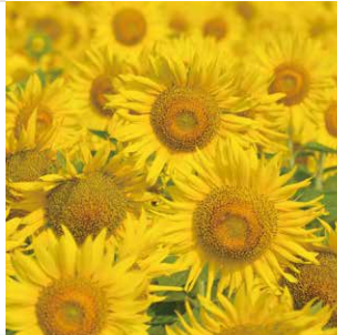
土成町のひまわり畑