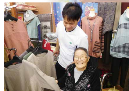
お気に入りの服を見つけてにっこり