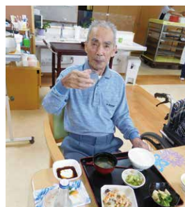
好きな日本酒(ノンアルコール)とお刺身にご満悦♪

誕生日は誰にも訪れる、年に1度の特別な日です。この特別な日が、利用者様の人生の中で、思い出に残る素晴らしい1日になるよう取り組んでいます。プレゼントをお渡すだけでなく、利用者様やご家族の希望をお聞きし、外出や外泊、外食の送迎などをサポートさせていただいています。お誕生日にご自宅まで送迎をさせていただいた際には、利用者様やご家族より「送ってもらってありがとうございます。」という嬉しいお言葉をいただきました。