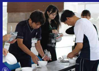
①地域の方も防災訓練に参加 ②非常食・飲料水の備蓄品 ③消防隊員からの訓練指導 ④避難訓練 真剣に参加してくださる利用者様 ⑤防災訓練に対してNHKのインタビューを受けるEPA介護福祉士候補者 ⑥消火訓練 ⑦炊き出し訓練 ⑧防災設備の一部 ⑨非常食けんちん汁の試食