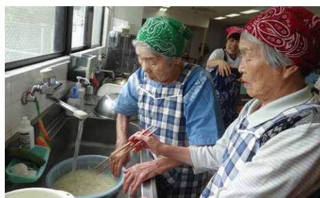
お昼ごはんの一品づくり

健祥会デイサービスセンターでは、住み慣れた地域やご自宅でいつまでも安心して生活ができるように支援しています。少人数で家庭的な雰囲気のなかで、利用者様それぞれの好みに合った、様々なレクリエーション、園芸活動、家事を通じた生活リハビリや機能訓練を行いながら、認知症の進行予防と身体機能の維持・改善に取り組んでいます。