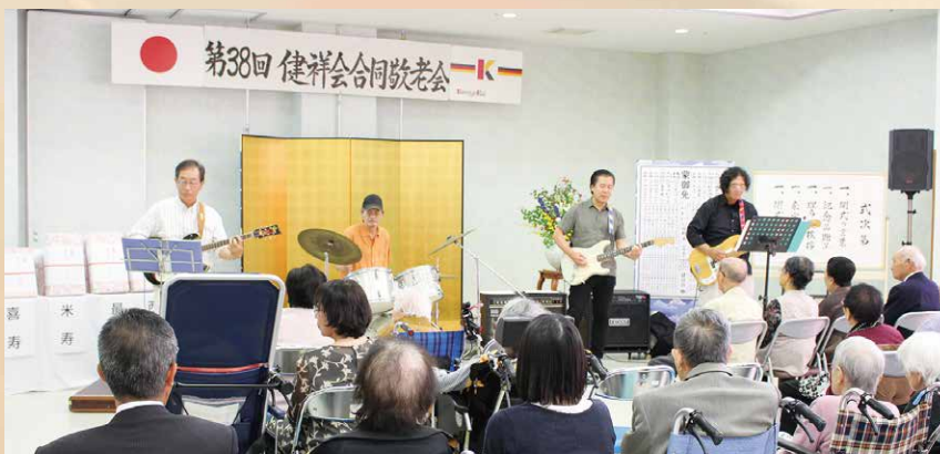
第38回健祥会合同敬老会 水明荘・吉野川リハビリセンター 阿波ベンチャーズによるバンド演奏

健祥会グループの合同敬老会は、施設の利用者様も在宅のみなさまも、揃ってご長寿をお祝いしようと、昭和55年グループ発祥の地である特別養護老人ホーム水明荘の開所とともに始まりました。施設のこともっと知っていただきたい、地域のみなさまとの関わりを深めたいとの想いを受け継ぎ、38回目の合同敬老会を開催しました。