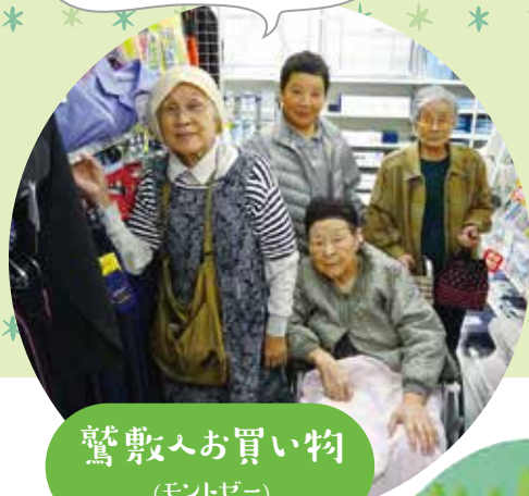
驚敷へお買い物 (モントゼー)