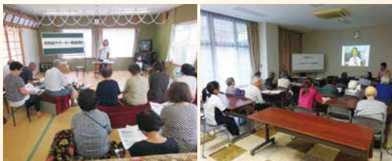
北河内集会所にて(ふるさと那賀)