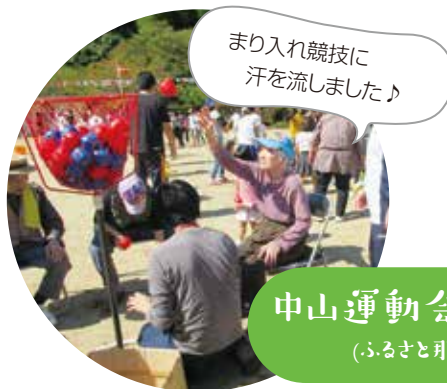
中山運動会へ参加 (ふるさと那賀)