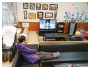
くつろぎのある空間