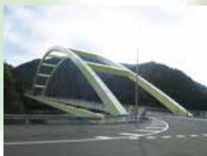
出合ゆず大橋(旧上那賀町)