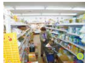
(写真) ①季節の外泊 ②映画上映会 ③屋外体操 ④茶話会 ⑤モントゼー掲示板 ⑥手芸大会 ⑦外食 ⑧共同作品 ⑨お買い物