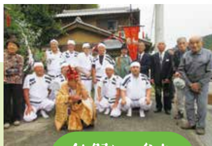
秋祭りに参加 (ふるさと那賀)