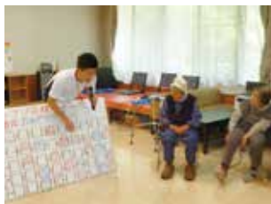
お誕生日イベント

サテライトは衛星の意味。本体から離れて存在することの例えです。きとうゆずをサテライトとし、チロルときとうゆずの2カ所を一体的に運営します。