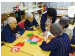
職員との共同作業