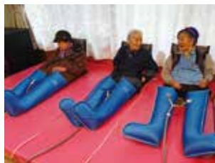
メドマーで両足のマッサージ