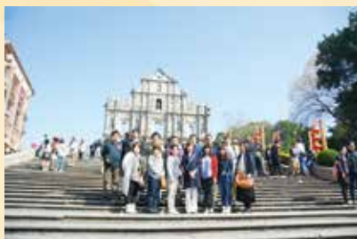
マカオ 聖ポール天主堂跡

職員の福利厚生のひとつとして、たくさんの企画の中から希望のコースを選んで参加する職員親睦研修旅行。その土地の風土を味わい、歴史や伝統文化を学ぶとともに、他施設の職員と交流を深める貴重な機会でもあります。