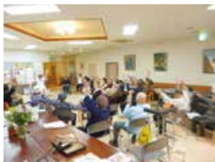
理学療法士による集団体操