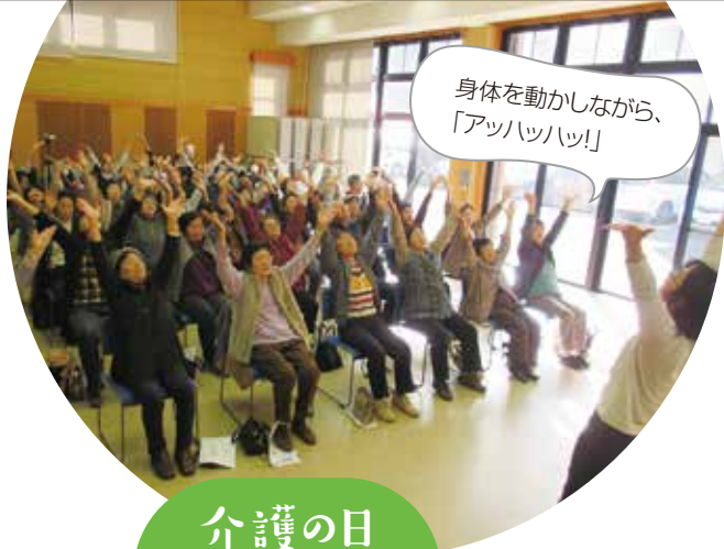
介護の日 笑いヨガ体操 (ふるさと那賀)