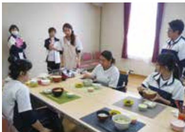
利用者様の気分になって