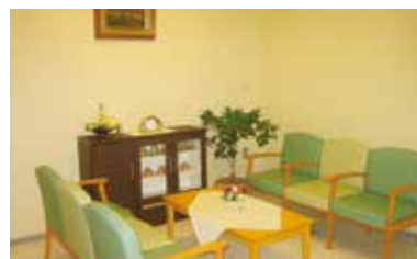
セミパブリックスペース