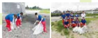
■河川敷のゴミ拾い実施 早朝からみんなでたくさんのゴミを拾いました。