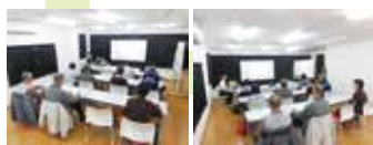
■認知症サポーター養成講座開催