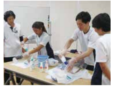
正しい排泄ケアとは・・・