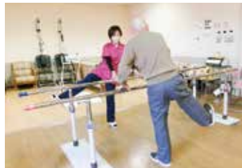
機能訓練指導員による体操