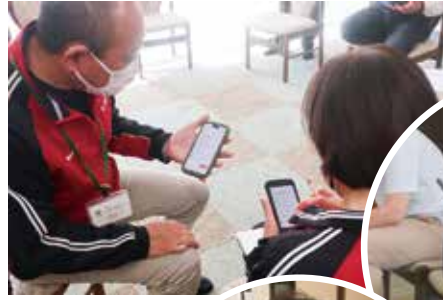
アプリを用いた緊急連絡訓練

大規模災害時の通信手段の一つとしてGPSトランシーバーを活用し、各施設との通信状況や、ステージ全体の被災状況などを確認する訓練を行いました。また、緊急連絡時の手段として携帯アプリを導入しました。このアプリでは一斉にメッセージを送ることができるため、これまでの電話での連絡方法より、早く正確な情報共有ができるようになりました。