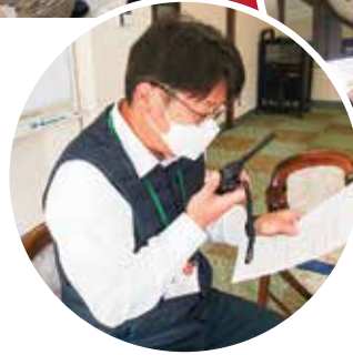
トランシーバーを用いた通信訓練