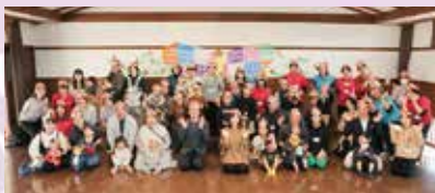
子育て支援「KIRARI 仕事と子育て両立パワセミナーイベント」