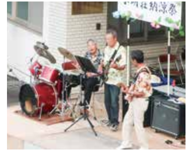
『阿波ベンチャーズ』による迫力の演奏！