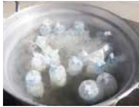
炊飯袋を使用しての調理