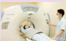
ヘルスサポート制度