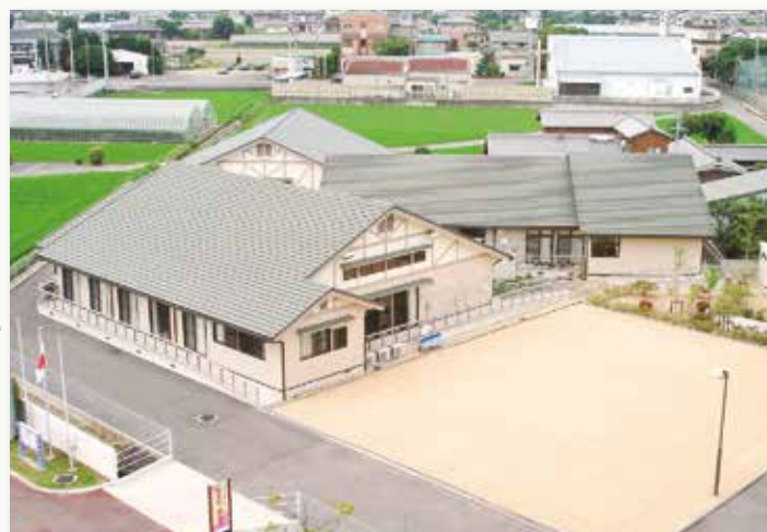
礼あり優あり/20周年