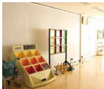
機能訓練室/レクリエーション用品も充実