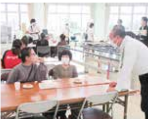
お茶を飲みながらの介護相談

認知症の方が住み慣れた地域で生活しながら、社会に参加し続けられるように地域全体で支援する交流の場です。今後も定期的に開催しますのでどなたでもお気軽にお越しください。