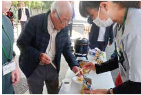
災害時に備え、非常食の炊き出し訓練を地域の方とともに行いました。