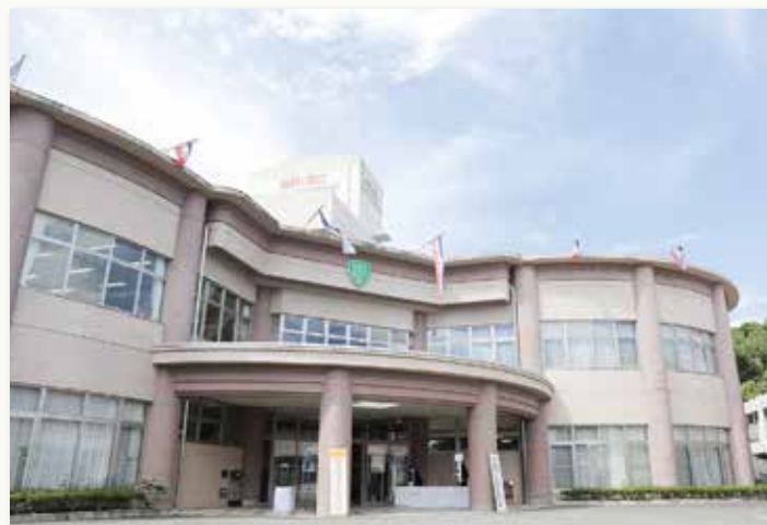
健祥会インディペンデント21/20周年