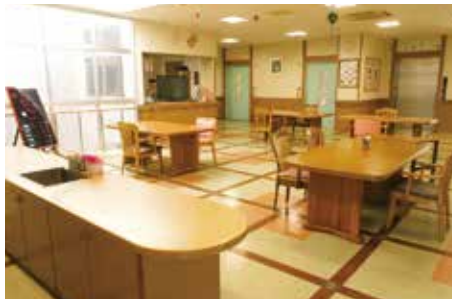
アネックス 4階 フロア