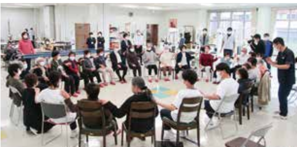
認知症予防体操で会場大盛り上がり！