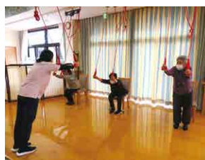
スリングセラピー