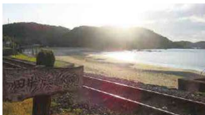
田井ノ浜海水浴場