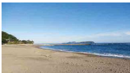
大砂海水浴場海岸