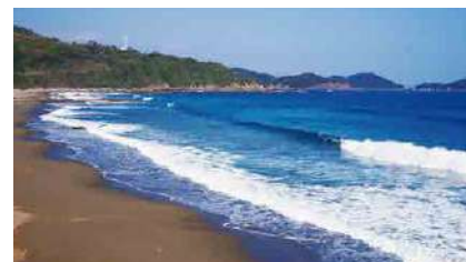
生見サーフィン場