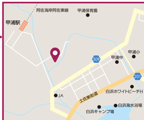
グループホーム 慎太郎 デイセンター 海援隊