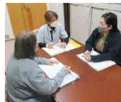
カンファレンス、訪問の様子

対 象：要介護認定で「要支援(1~2)、要介護(1~5)」の認定を受けられた方 ※要支援の方は牟岐町総合支援事業対象となります。