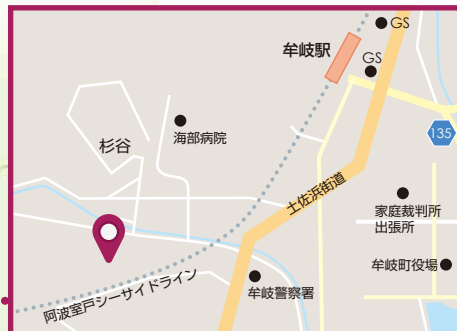
特別養護老人ホーム 緑風荘