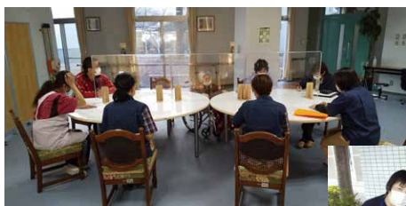
多職種カンファレンス

徳島県美馬市脇町字拝原1354番地5 TEL : 0883-53-0303 FAX : 0883-53-0430 開所 : 2018/10/1