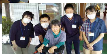
施設生活から自宅での生活へ戻ります