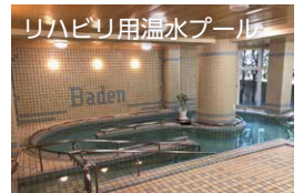
リハビリ用温水プール