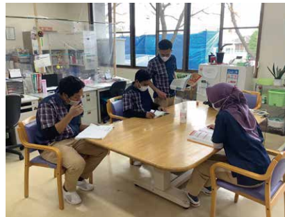
先輩EPA職員による 候補者への学習支援 2021.11.25

インドネシア、フィリピン、ベトナムから介護福祉士候補者を積極的に受け入れ、日本国内だけでなく海外でも優秀な人財発掘を行っています。EPA介護福祉士候補者が長く職場定着できることを目的とし、「メンター制度」を導入しています。先輩EPA職員が指導を行う「メンター」、後輩EPA職員が指導を受ける「メンティー」に分かれ、仕事や私生活でのアドバイスや日本語学習の支援などを行っています。日本人とは異なる価値観や文化を持つ人財とともに仕事をし、グローバル化が進むことで、日本の介護・福祉に関する知識をEPA介護福祉士候補者に伝えていく働き方が広がっています。