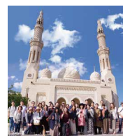
2020年 / ドバイ

3年に1度の職員親睦研修旅行。さまざまな企画の中からコースを選んで参加できます。 ※令和2年度、3年度については、新型コロナウイルス感染拡大防止のため職員親睦研修旅行は中止となっています。