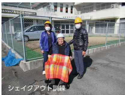
シェイクアウト訓練