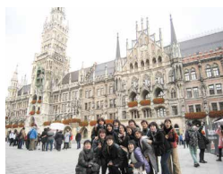
2017年 / ドイツ