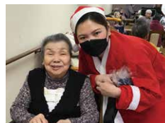
メリークリスマス