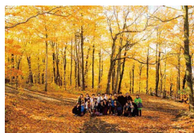
2018年 / カナダ