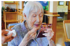
メイクセラピー 96歳には、とても見えません