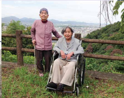
8月『山から景色をみたい』