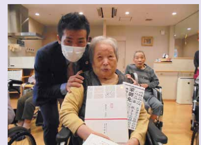
9月『元気で長生きして下さいね』