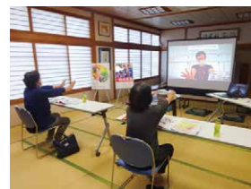
老人保健施設 ジャンボ緑風会 2021.8.25