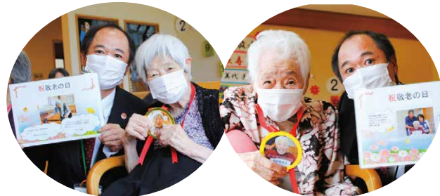
合同敬老会 /2021.9.17 手づくりのメダルとメッセージカードでお祝いました