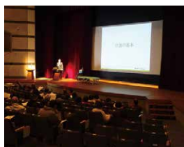
シルバー大学校 徳島校 2021.10.22