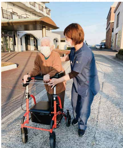
訪問リハビリテーション

理学療法士、作業療法士が介護保険による通所リハビリ、訪問リハビリを行います。利用者様のやりたい事を実現できるよう、専門スタッフがサポートいたします。