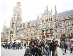
2017年 / ドイツ