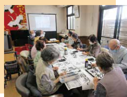
オンライン習字教室

多種多様なレクリエーションで、楽しい時間を過ごします。今日は何のレクリエーションかな。