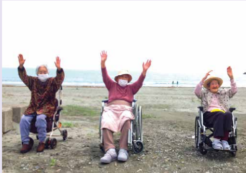
8月『思い出の海にもう一度行きたい』