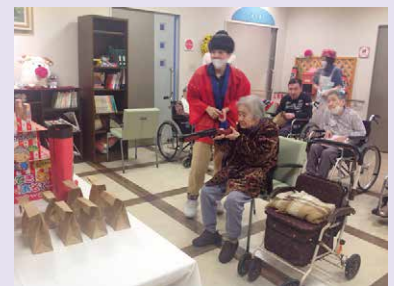
8月『射的やくしぶりやなあ』