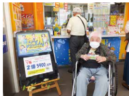
宝くじ購入 1等が当たるかなあ～