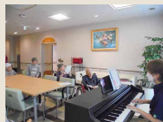
リズムにのって音楽クラブ ♪♪

笑顔につながる自立支援を実践! 利用者様の自立支援、介護の質向上に向け、定期的に職員同士で話し合いを行い、利用者様の笑顔が増えるように支援しています。様々なクラブ活動も実施しており、趣味活動の時間を大切にしています。