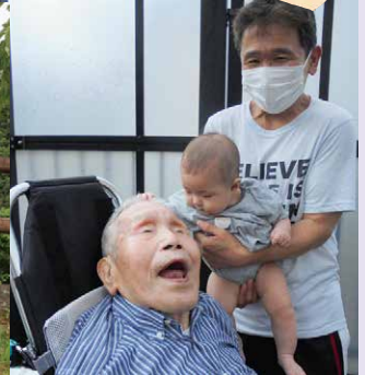
8月『家族と家で過ごしたい』