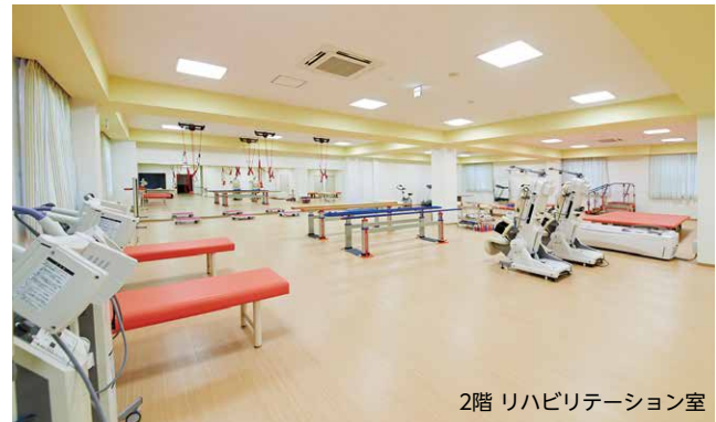
2階 リハビリテーション室