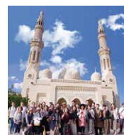
2020年 / ドバイ

3年に1度の職員親睦研修旅行。さまざまな企画の中からコースを選んで参加できます。