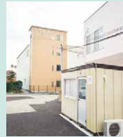
発熱者患者等専用診察室

コロナ禍において身近で早く検査を受けていただける医療機関として、令和2年10月23日徳島県より「診療・検査協力医療機関」の指定を受けています。また、濃厚接触者も検査が行える医療機関として徳島保健所と連携を図り、検査要請も積極的に受け入れてきました。院外に発熱者専用の検査場を設け、安全な検査体制を整備しております。抗原検査、PCR検査、陰性証明書発行等が必要な方は、お電話にてご相談を承っております。