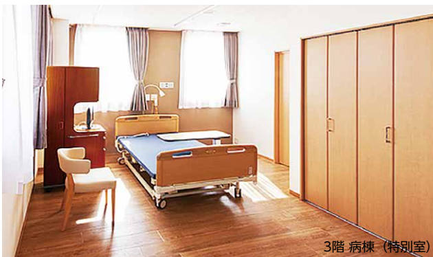
3階 病棟 (特別室)