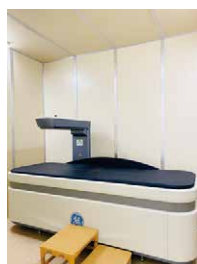
骨密度測定装置 (DEXA法)