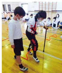
若者向け介護体験 (松茂小学校) 2021.10.26

一般の方向けの介護に関する基礎的な研修、介護職員向け研修、企業向け研修、学生を対象とした若者向け介護体験・イメージアップ講座、教員・指導者向け介護講座など、様々な講座を開催していますので、お気軽にお問い合わせください!