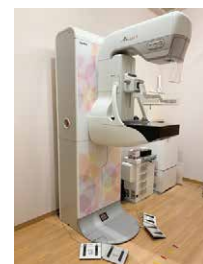
デジタルマンモグラフィ システム