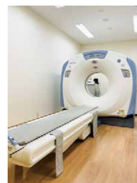
CTスキャナシステム