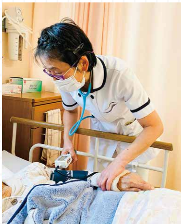
バイタルチェック

19床の入院病床があり、経験豊富な看護・介護スタッフが安心できる入院生活をサポートいたします。退院後に介護サービスが必要となった場合、健祥会グループの介護・福祉サービスのご案内もさせていただきますので、ご相談ください。