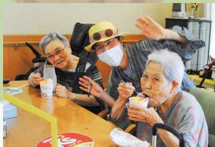
納涼祭 / 一心太助 2021.7.29

コロナ禍のため、施設ごとでの開催となりました。納涼祭はイベントや模擬店など充実した内容で笑顔溢れる良い機会となっています。合同敬老会ではご長寿を祝うとともに日々の感謝を伝えています。