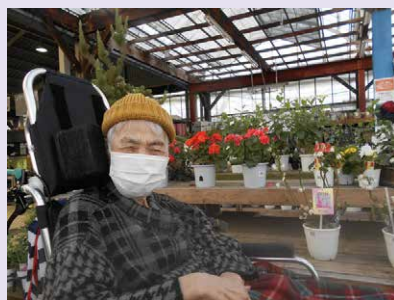
10月 『お気に入りの職員とデートがしたい』