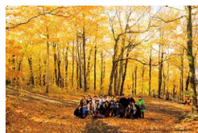
2018年 / カナダ