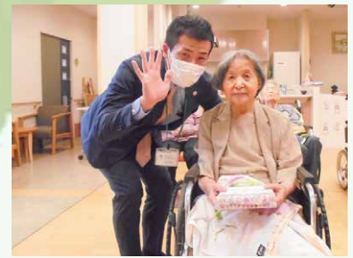
合同敬老会 / 笑顔 2021.9.22