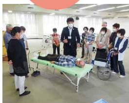
シルバー大学校 東みよし校 2021.10.13

徳島県内8か所の施設や県内各地のシルバー大学校を会場とし、介護に関する入門的な研修を行っています。介護保険制度の基礎から認知症についてなど、介護に関する知識・技術を学ぶことができます。令和3年度はコロナ禍の状況を鑑み、Zoomを活用したオンライン受講と来場受講を合わせたハイブリット形式で実施しました。