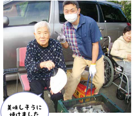
美味しそうに焼きました