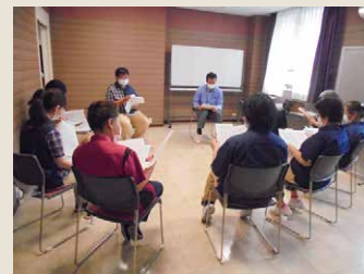
笑顔ミーティング