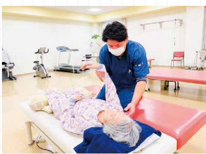
疾患別リハビリテーション

主に整形外科疾患の患者様を対象に、ADL・QOLの向上をめざし、理学療法士、作業療法士が運動療法、徒手療法、日常生活動作訓練などを行っています。