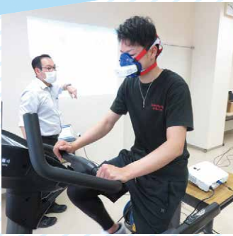
酸素摂取量計測中！

『治す技術』と『癒す心』を兼ね備え、社会に貢献できる理学療法士を育成しています。