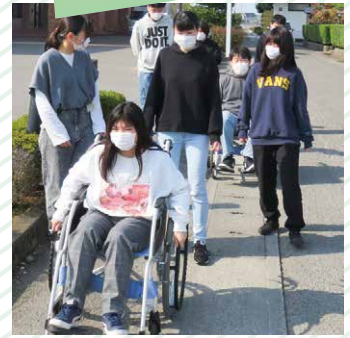
車いすで周辺を散策中