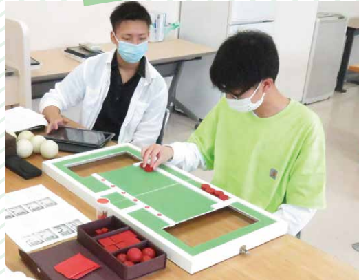
手の評価について学びます