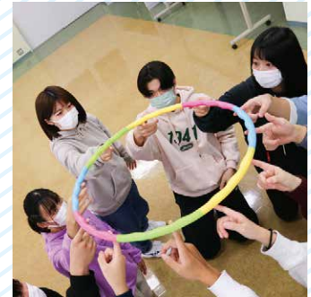
チームワークの大切さを学びました