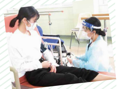
感染症対策を学びました