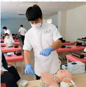
吸引技術を習得中！