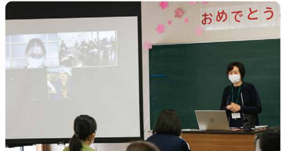
健祥会グループの認定こども園とリモート 接続し、現場の様子を知ることができました。