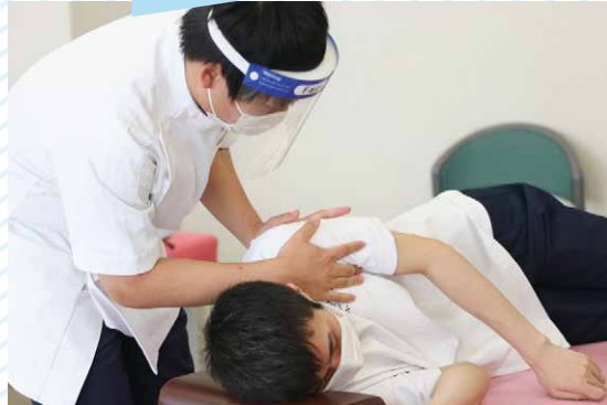
フェイスシールドを付けて実際の場面を想定し実技演習を行いました