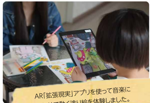
AR「拡張現実」アプリを使って音楽に 合わせて動く塗り絵を体験しました。