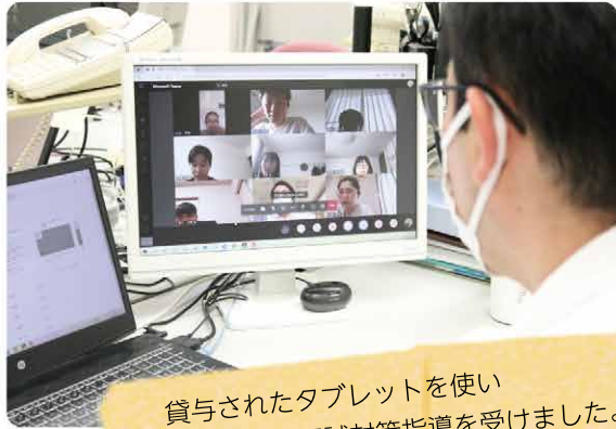
貸与されたタブレットを使い リモートで国試対策指導を受けました。