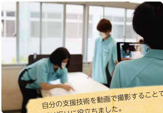
自分の支援技術を動画で撮影することで 振り返りに役立ちました。