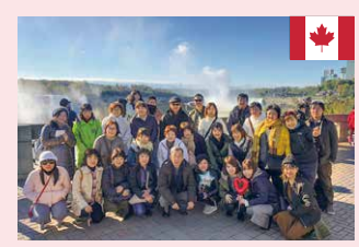
カナダ (ナイアガラの滝)