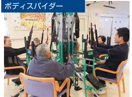
ボディスパイダー

ドイツ製の多機能健康器具「ボディスパイダー」は大人数で同時に使用することを主眼に作られています。 仲間ですら座になって楽しくトレーニング できるので利用者様にたいへん好評です。