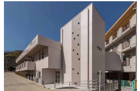
2017年3月に本館南側にオープンした新棟「バーデン アネックス」

☎087-893-1220 【営業日及び営業時間】 月曜日～金曜日（365日24時間対応） 8:30～17:30 【職員配置】 主任介護支援専門員 【実施地域】 高松市南部